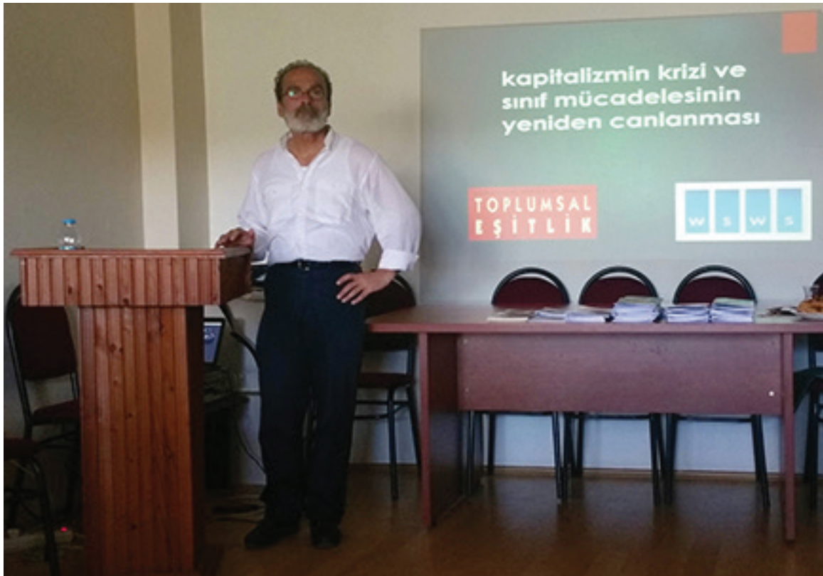
ධනවාදයේ අර්බුදය සහ පන්ති අරගලයේ යලිපිබිඳීම ගැන 2016 ඉස්තාන්බුල්හි සම්මේලනය අමතන සෙලික්

හලිල්ගේ කන්ඩායම 1996 දී, ස්ථාලිත්වාදී හා වාමාංශික සුදු-ධනපති කන්ඩායම් ගනනාවක් ඒකාබද්ධව තනා ගන්නා වූ ද, බොහෝ කම්කරුවන් හා සටන්කාමී තරුණයන් ආකර්ශනය කර ගත් සංවිධානයක්