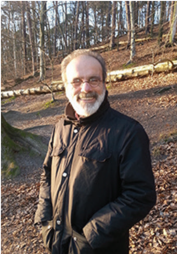
හලිල් සෙලික් 2016 පෙබරවාරියේ බර්ලින්හි දී

වෙබ් සියලු ස්ථ ඵසිටිලික් කන්ඩායමේ ආරම්භකයා හා නායකයා වූ හලිල් සෙලික් ඉස්තාන්බුල්හිදී 2018 දෙසැම්බර් 31 වන දින පිලිකා රෝග යෙන් අභාවප්‍රාප්ත විය. මිය යන විට 57 වන වියේ පසුවූ ඔහු වසර හතළිහකට වැඩි කාලයක් පුරා සමාජවාදය සඳහා අරගලයට සිය ජීවිතය කැප කල අතර, ඉන් අවසාන දශක දෙකහමාර ඔහු කැප කලේ තුර්කිය තුල හතරවැනි ජාත්‍යන්තරයේ ජාත්‍යන්තර කමිටුවේ (හජාජාක) ශාඛාවක් ගොඩනැගීමේ අරගලය සඳහාය.