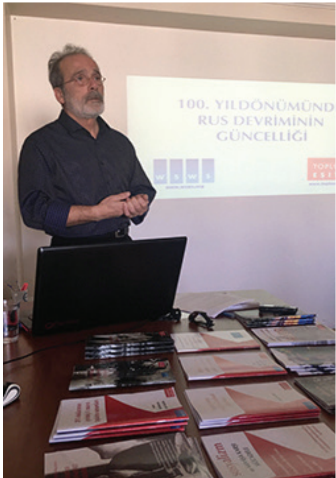
2017 රුසියානු විප්ලවයට සියවසරක්

සෝවියට් සංගමය විසුරුවා හැරීමෙන් පසු ජාත්‍යන්තර කමිටුව, ජාතීන්ගේ ස්වයංනිර්නය අයිතිය සම්බන්ධ සිය ආස්ථානය පිලිබඳව බරපතල සමාලෝචනයක් සිදු කොට තිබින. මේ කාල පරිච්ඡේදය තුල අධිරාජ්‍යවාදී බලවත්හු තමන්ගේම උත්සුකයන් තහවුරු කර ගනු වස් ජාතිකවාදී, වාර්ගික හා ආගමික ආතතීන් හිතාමතාම ඇවිස්සීමට කටයුතු කලෝය. යුගෝස්ලාවියාවේ, ඉහත සෝවියට් සංගමයේ හා මැද පෙරදිග ජාතික ව්‍යාපාර, ඉන්දියාවේ හා චීනයේ ජාතික ව්‍යාපාරයන් සිදු කල පරිදි අධිරාජ්‍යවාදයට එරෙහි පොදු අරගලයක් තුල විවිධාකාර ජනයා එක්සත් කිරීමට ප්‍රයත්න නොදැරූ අතර, ඒ වෙනුවට අධිරාජ්‍යවාදී බලවතුන්ගේ හා දේශීය සුරාකන්නන්ගේ උත්සුකයන්ට අනුව පවත්නා රාජ්‍ය කැබලි කිරීමේ ප්‍රයත්නයක යෙදී ගත්හ. එවැනි බෙදුම්වාදී ව්‍යාපාරවලට එරෙහිව විච්චනාත්මක හා සතුරු ආකල්පයක් ගත් ජාත්‍යන්තර කමිටුව කම්කරු පන්තියේ ජාත්‍යන්තර